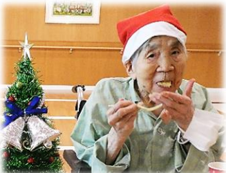
ニッコリ笑ってケーキに舌鼓