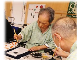
縦長な半紙に苦戦中?