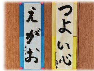
上手に書き上げられました!

1月22日には老健に伺い、書初めをしました。普段より長さが倍近くある二尺半紙に筆を走らせ、真剣に取り組んでおられました。なお、患者様の書き上げられた作品は3F ロビーに展示中です。写されている以外の作品もありますのでぜひご覧になってください!