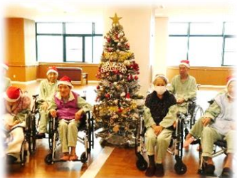
締め括りは皆さんで記念撮影!

12月25日のクリスマス会では、前回大盛り上がりだったビンゴ大会を再度実施し、当選した方から好みのプレゼントを選んでいただきました。当たり外れに一喜一憂しながら、その後のケーキも堪能。最後にツリー前で記念撮影し、皆が満ち足りた時間を過ごしました。