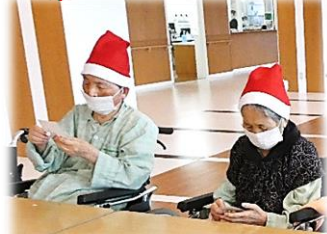
サンタ帽が似合っています♪