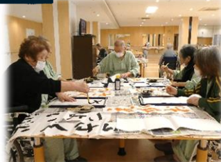
2F 老健にお邪魔しました