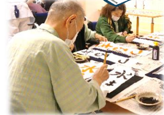
真剣に取り組んでおられます