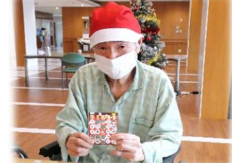
お目当てのプレゼントに笑顔